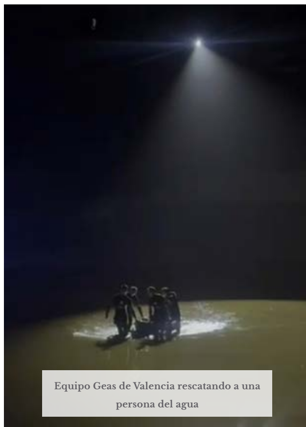
Equipo Geas de Valencia rescatando a una persona del agua