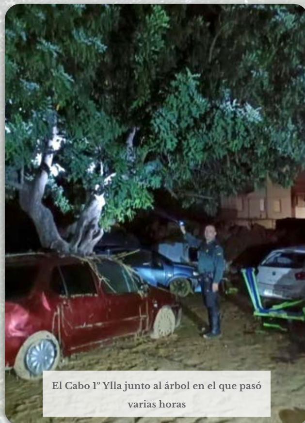
El Cabo 1° Ylla junto al árbol en el que pasó varias horas

En Cheste, el Cabo 1° Quique, también franco de servicio, rescató a vecinos atrapados en tejados y vehículos utilizando maquinaria pesada que consiguió movilizar en tiempo récord.